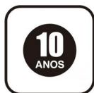
Selo de garantia de uso - Homogêneos