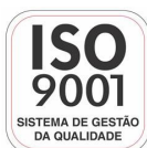
Fabricante Certificada ISO 9001:2008