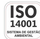
Fabricante Certificada ISO 14001:2004