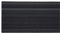
003 - Bréscia