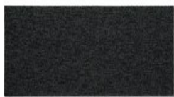
103 - Seal