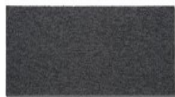
102 - Phantom