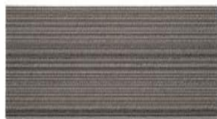
001 - Ravena