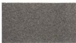
101 - Khaki