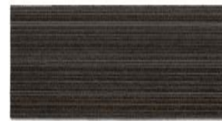
005 - Trento