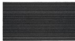
004 - Águila