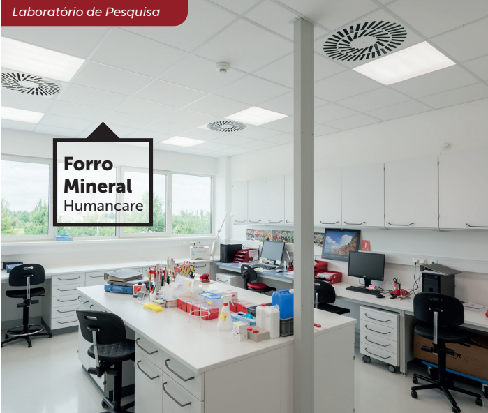
Laboratório de Pesquisa

Hospital Municipal Mario Gatti - Campinas/SP