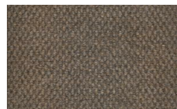
806 - Bege