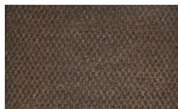
800 - Lever