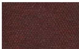
802 - Red