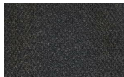
805 - Grey