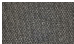
807 - Mist