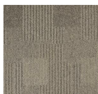
051 - Duna