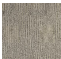
050 - Fendi