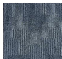
052 - Celeste