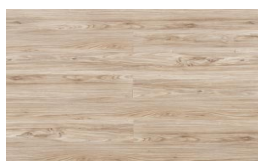
203 - KW 5011 - Alpino