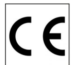
Produto autorizado para comercialização na União