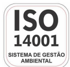
Fabricante Certificada ISO 14001:2004