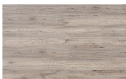
205 - KW 6051 - Pátina