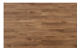
202 - KBW 8511 - Bruges