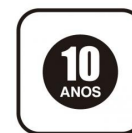
Selo de garantia de uso em área residencial