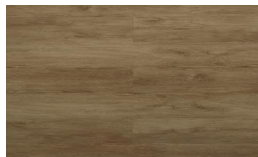
207 - KW 5104 - Victoria