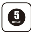
Selo de garantia de uso em área comercial