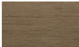
208 - KW 6071 - Malbec