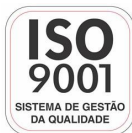
Fabricante Certificada ISO 9001:2008