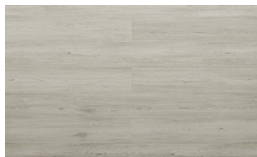
209 - KW 6154 - Maple