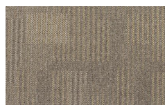
057 - Savanna