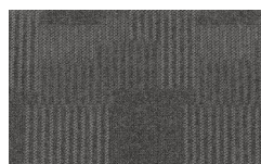
060 - Time