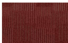
061 - Furnace