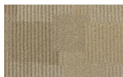
055 - Fancy