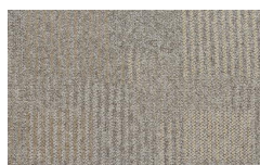
056 - Native