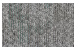
054 - Steel