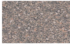
103 - Mortar - LRV-23