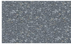
102 - Pearl Granite - LRV-19