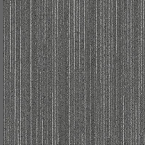
003 - Upload