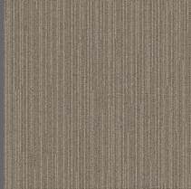
006 - Plug