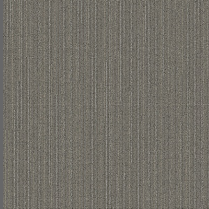
005 - Streaming