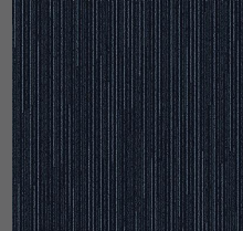
004 - Link