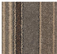
150 - Ginger