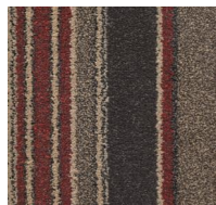
152 - Red