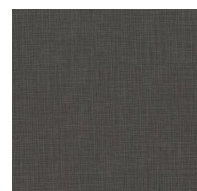
205 - Maps