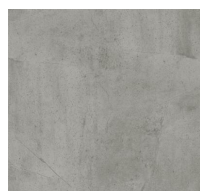
203 - Station