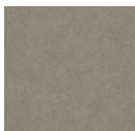
201 - Sandbox