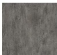
204 - Storm