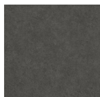
202 - Blackout