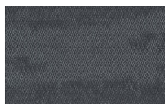
003 - Tiempo