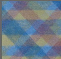
Textile - 006 Crayon