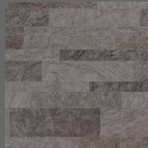
Stone - 003 Khaki Sand