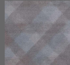
Textile - 005 Mint Choco