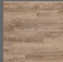
Durable - 009 Oak