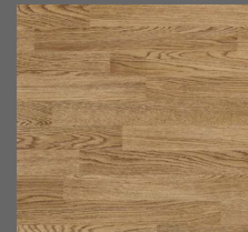
Durable - 010 Deckwood