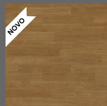
Durable - 012 Pine