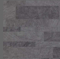
Stone - 004 Pure Steel