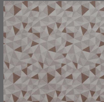
ABC - 002 Rainbow