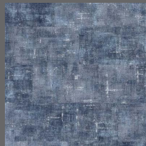
Textile - 008 Deep Sea Navy