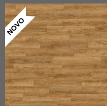
Durable - 011 Ebony