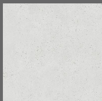
001 - Soho