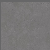
003 - Bronx