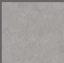
002 - Queens